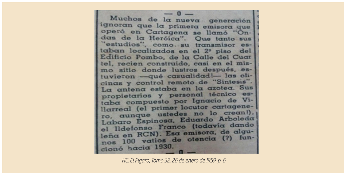
HC, El Figaro, Tomo 32, 26 de enero de 1959, p. 6