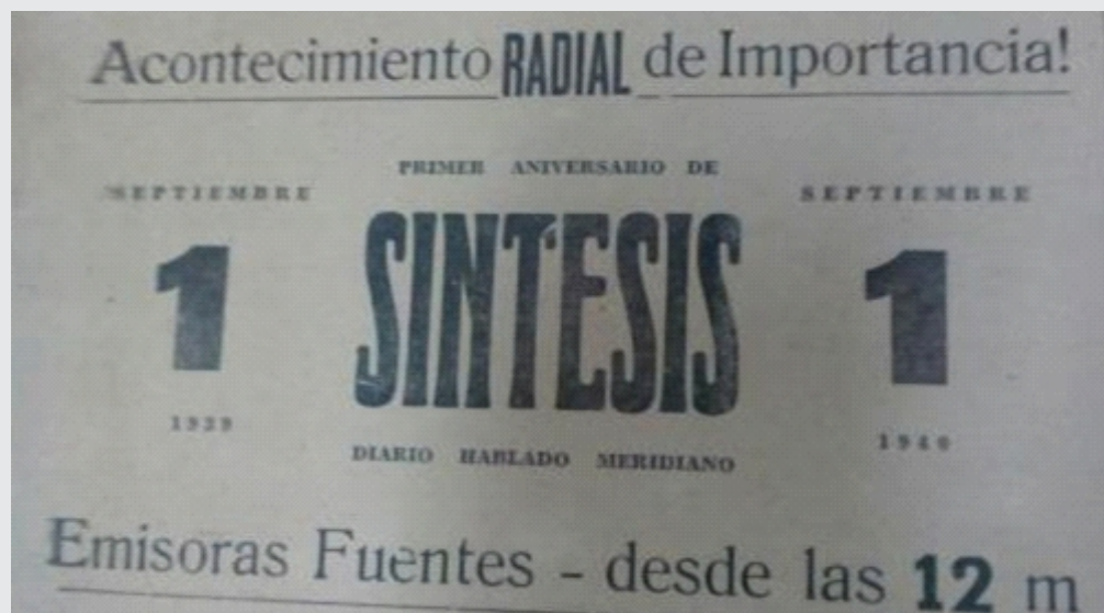
AHC, El Figaro, Tomo II, 29 de agosto de 1940, p. 8

La Emisora Fuentes fue la primera en hacer radio periodismo, en el llamado "Acontecimiento radial de importancia", momento en el cual funcionó como radio periódico. Curiosamente, este radio periódico se presentó por primera vez el primero de septiembre de 1939, fecha exacta de la Segunda Guerra Mundial, por lo cual la ciudad se interesó mucho en esta sección informativa, pues en ella se anunciaban los acontecimientos de esa guerra.