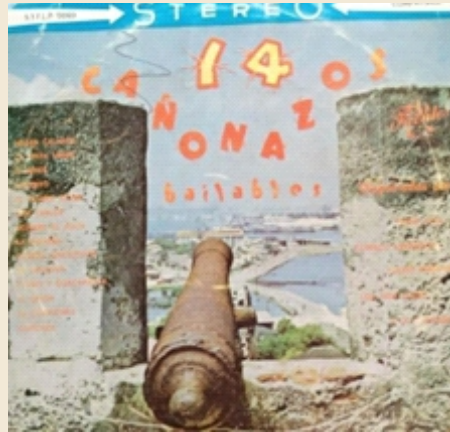
Figure 11 El volumen I de 14 Cañonazos Bailables que salió en octubre de 1961, a un precio de 60 centavos de la época.