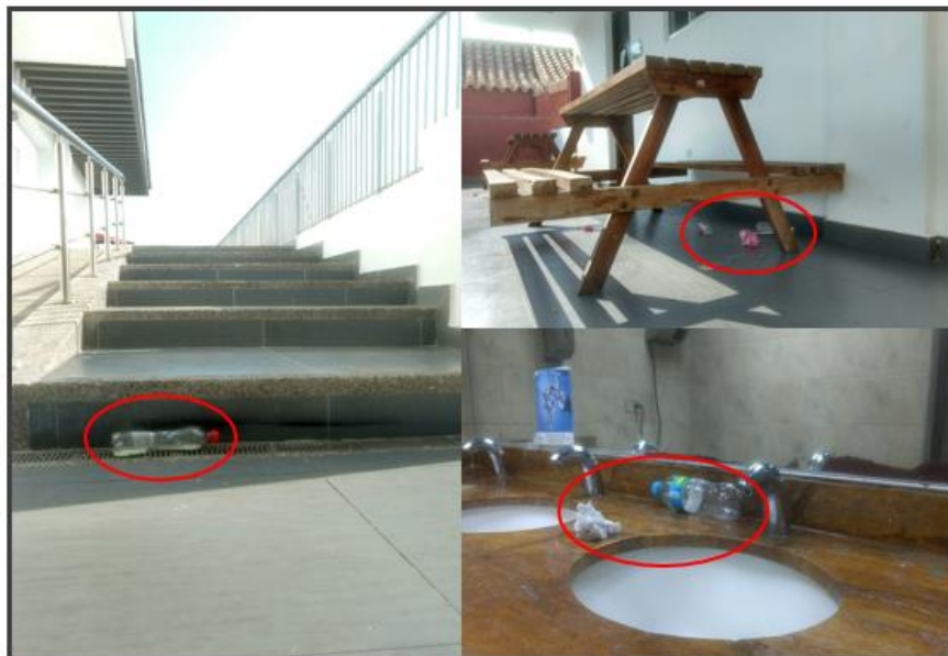
Ilustración 1. Presencia de residuos sólidos en diferentes zonas públicas del campus universitario.

¿Cómo se logra fomentar la cultura ambiental en la comunidad universitaria de Unibac?