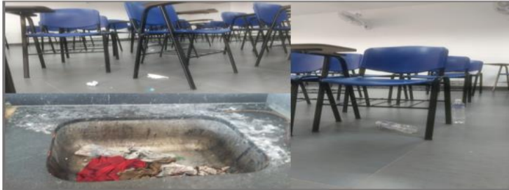
Ilustración 2. Aulas con disposición inadecuada de residuos sólidos