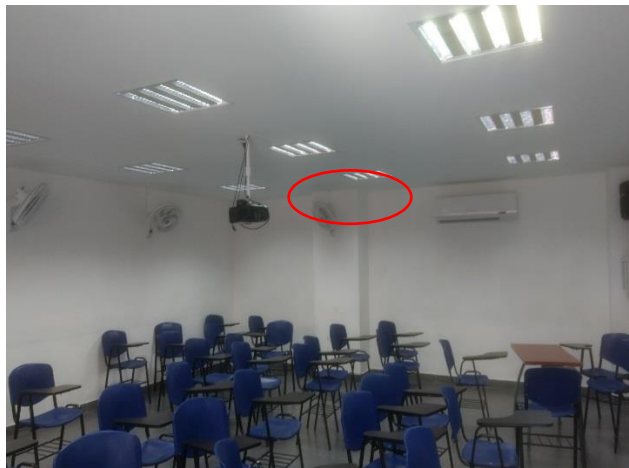
Ilustración 3. Aulas vacías con lámparas, ventiladores y aire acondicionado encendidos.